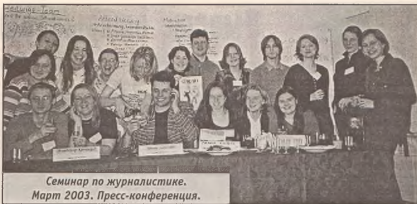
Семинар по журналистике. Март 2003. Пресс-конференция.

За время своего пребывания иностранные стажеры центра, а также омские выпускники образовательных программ прочитали несколько лекций в школах и университетах Омска и области: ОмГПУ, ОмГУ, педагогический колледж, общеобразовательные школы № 1 и № 2 (г. Калачинск), школа № 6, школа № 140, школа № 66, гимназия № 19, общеобразовательная школа № 1 (Тюкалинск), школа № 62 и др.