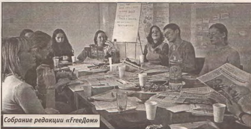
Собрание редакции «FreeДом»

Общество свободных путешественников, г. Омск ( www.extremetravel.good.ru )