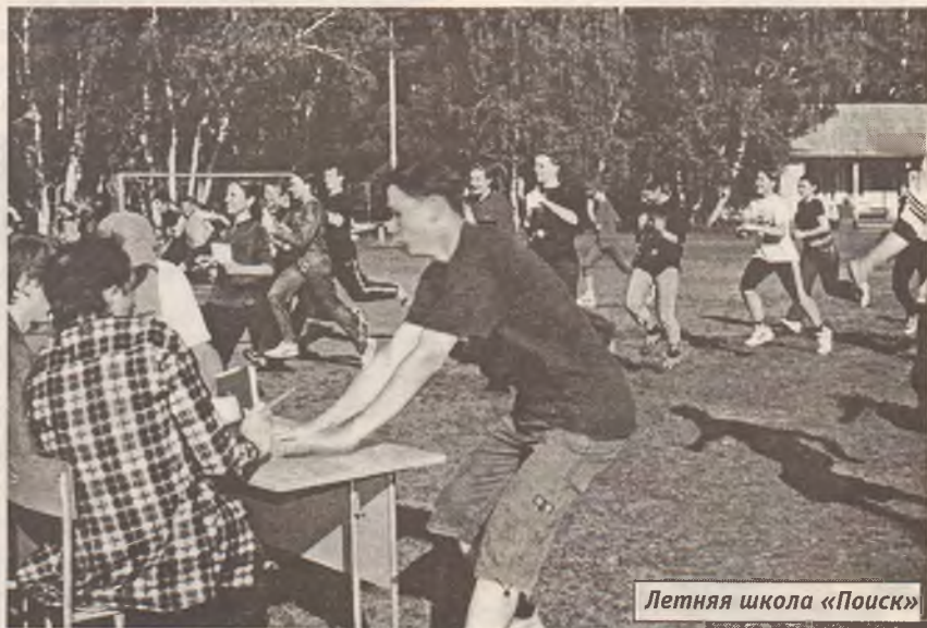
Летняя школа «Поиск»