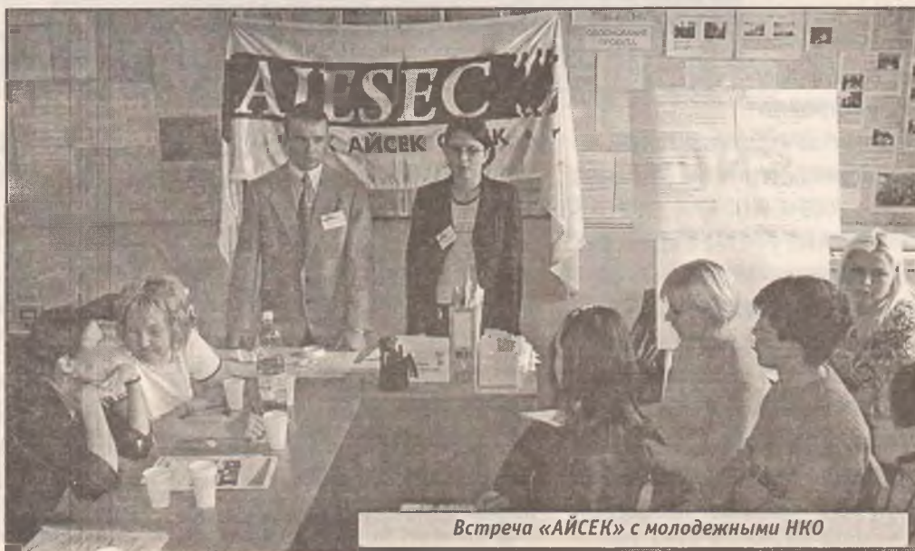
Встреча «АЙСЕК» с молодежными НКО

Координаты: 644077, г. Омск, ул. Андрианова, 28, ауд.311 (в помещении третьего корпуса ОмГУ) e-mail: omsk@aiesec.net www.aiesec-omsk.narod.ru