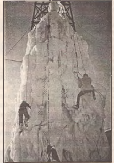
Кайсы (правый приток р. Иртыш), поиск родников – 1999 г.;

Круг профессий, для которых необходимы навыки движения по «вертикали», значительно расширил-