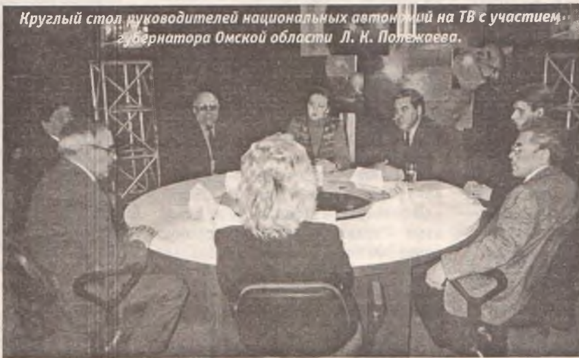
Круглый стол руководителей национальных автономий на ТВ с участием губернатора Омской области Л. К. Полежаева.

к руководству региональной телекомпания, а также в Москву и Казань. Автор указывает, что тем самым грубо нарушается федеральный закон о национально-культурных автономиях, недвусмысленно обязывающий государственные СМИ вести бесплатную трансляцию передач на языках народов, проживающих в регионах. Договор между РНККА Омской области, как и другими автономиями, с ГТРК «Иртыш», РТРК «Омск» так и не подписан. Лидерам автономий меньше всего хотелось бы скандалить, но по-хорошему договориться пока не удается.