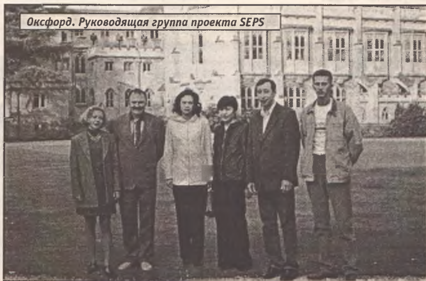
Оксфорд. Руководящая группа проекта SEPS