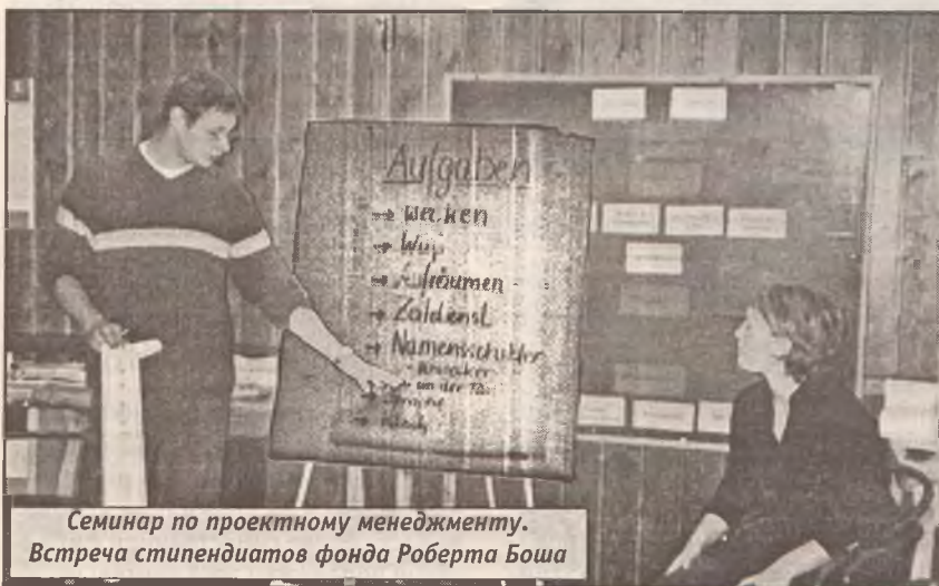
Семинар по проектному менеджменту. Встреча стипендиатов фонда Роберта Боша

Более подробную информацию о деятельности центра Вы можете найти на сайте www.freedomcity.info .