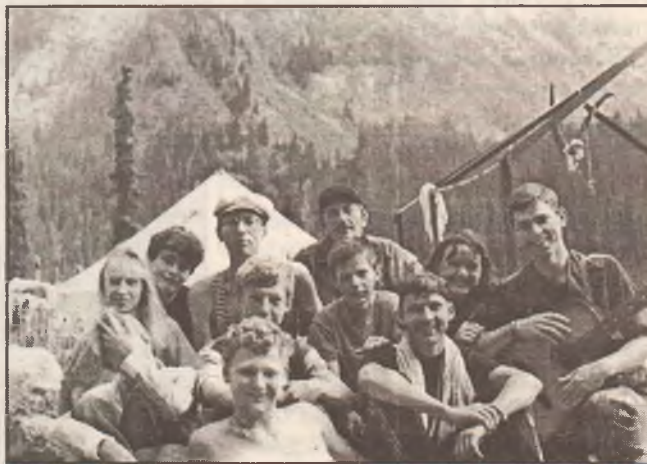
Экспедиция по следам Н. Певцова и н. Пржевальского по заданию Омского географического общества (1997г.)