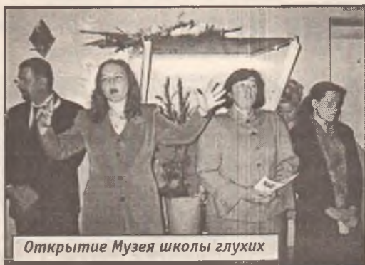
Открытие Музея школы глухих

- После прибытия в лагерь мне так сильно хотелось домой - грустила целый день. А на следующий день познакомилась с нашими ребятами и преподавателями. Мне очень понравились их отношения, теперь и у нас дружные и тесные отношения. Мы и балуемся и шутим, и делаем что угодно, теперь стало очень весело.