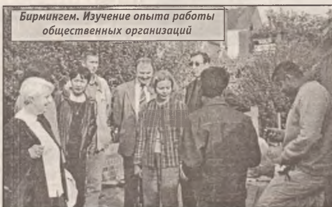
Бирмингем. Изучение опыта работы общественных организаций

Омские экологи уверены, что создание федерального заказника в районе Васюганских болот возможно при участии всех соседних регионов. Они провели консультации со своими коллегами из Новосибирской и Томской областей, Ханты-Мансийского автономного округа. Да и в Омске «Экологический комитет» нашел партнеров в 5 общественных организациях. А пока экспедиция из 7 человек с 22 сентября по 10 октября 2003 года обследовала омский участок Васюганья. На танкетке в тарский урман кроме ученых с проводником отправились охотоведы. Они порази-