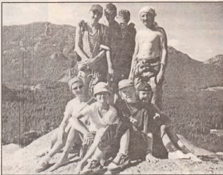
Горный лагерь в Боровом

Проекты скалодромов: школа №144- Так был модернизирован зал ТГТ (техники горного туризма); Переоборудуется в первый в Омске зал ОБЖ и туризма малый спортзал школы №144-2002-2003гг. и «Ска-