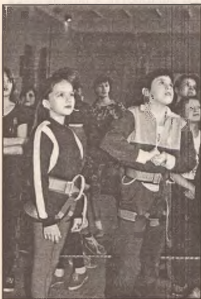
Первенство области среди школьников по скалолазанию. Скалодром школы № 144. Участники и болельщики.

С древних времен многие реки, озера, родники являлись местами отдыха, оздоровления, очищения. За чистоту, целебные свойства воды, глины, грязей месторождения и источники у разных народов Омской области нарекались священными.